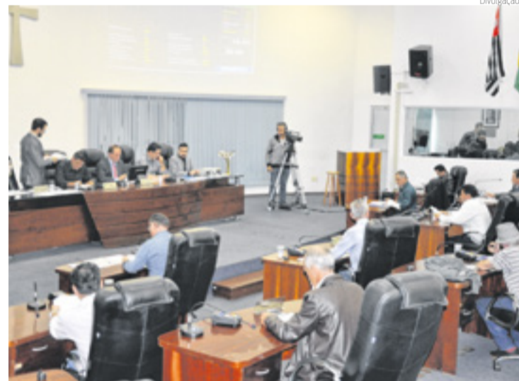
CÂMARA DE SANTA BÁRBARA | Maioria quer renovação